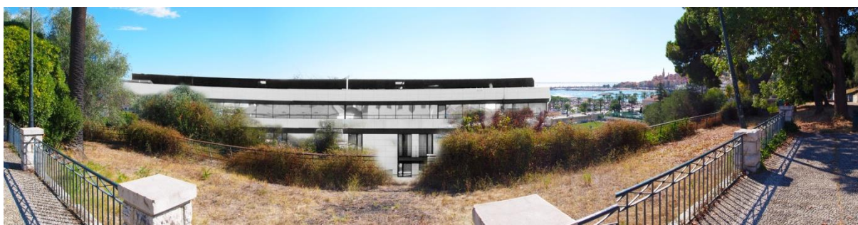
Photo montage tenant compte des données du permis de construire ...la mer n'est plus visible du Pian

Actuellement, au Pian, depuis le Belvédère, la vue est dégagée et la mer semble proche